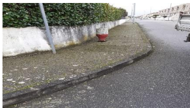
Limpeza dos caminhos no Bairro do Sol (Merelim S. Paio)