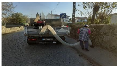
Remoção folhas caídas de árvores nos vários caminhos/passeios (Merelim S. Paio / Panoias / Parada Tibães)