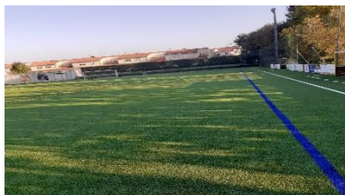
Substituição relvado campo futebol e limpeza regular das folhas caídas de árvores (Merelim S. Paio)