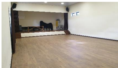
Aplicação novo pavimento salão Junta Freguesia (Panoias)