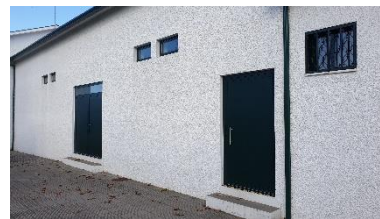
Aplicação nova caixilharia em alumínio no salão Junta Freguesia (Panoias)