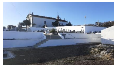
Pintura das paredes do cemitério (Merelim S. Paio)