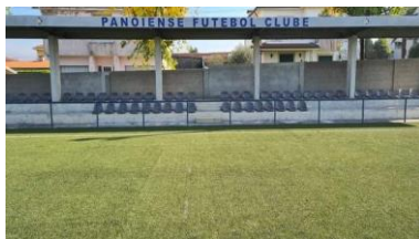
Colocação cadeiras na bancada Campo Futebol Panoiese F.C. (Panoias)