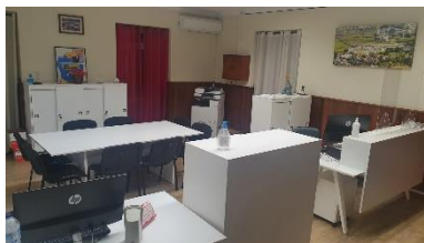
Renovação do mobiliário na Sede da Junta Freguesia (Merelim S. Paio)