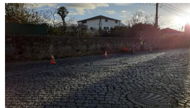
Limpeza das valetas e passeio da estrada que liga Ruães-Vieira (Merelim S. Paio)